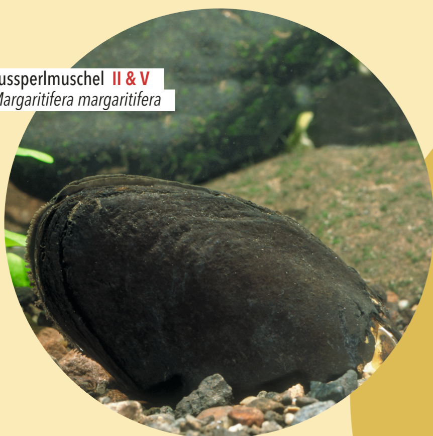
Fussperlmuschel II & V Margaritifera margaritifera