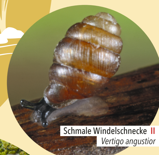
Schmale Windelschnecke II Vertigo angustior